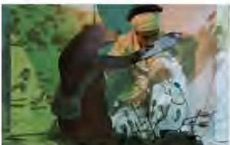
L'ours qui avait une épée, joué dans le Camion à histoires