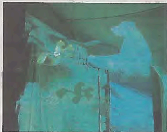
"L'ours qui avait une épée" sera le nouveau spectacle du camion à histoires.