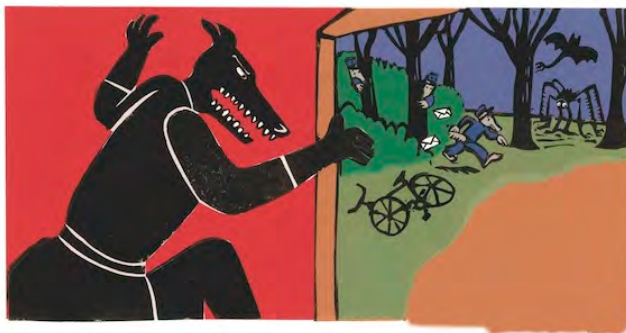
Illustration : Bruno Heitz

Bruno Heitz est un confectionneur, voire un bidouilleur. Passionné des matières, il n'a de cesse de diversifier ses techniques, pour renouveler l'imaginaire visuel des histoires. Pour cette histoire, il ose les aplats de couleurs les plus vives, la plus parlantes, dramatiques, théâtrales qui expriment magnifiquement les états d'âme des personnages, leur humeur et leurs préoccupations.