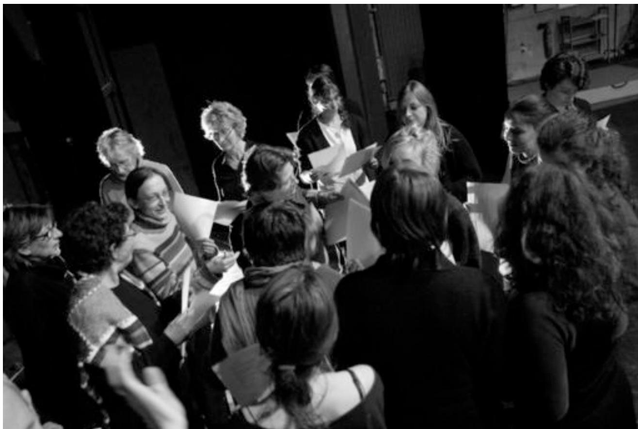
Mars 2008 au Théâtre de Privas