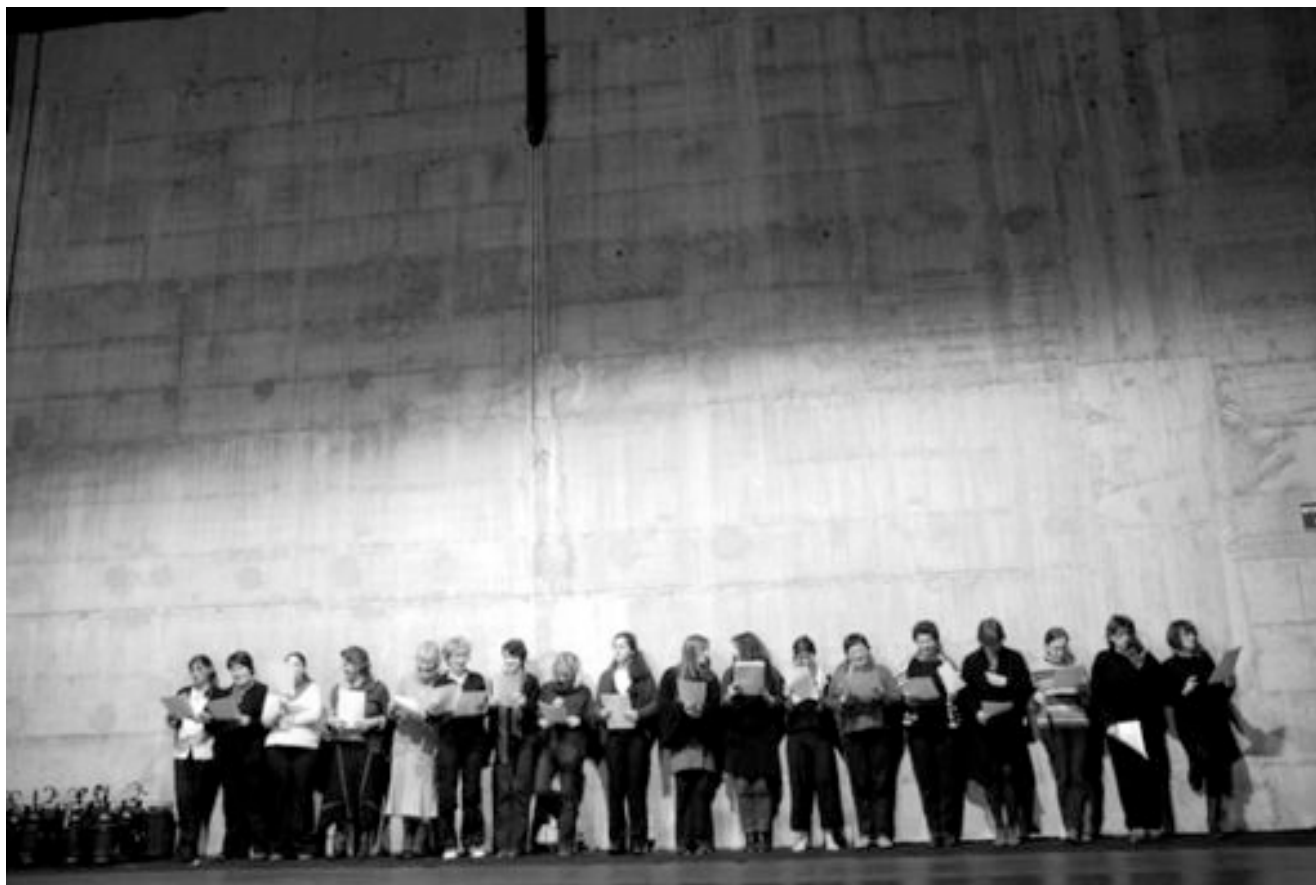
Décembre 2007 au Théâtre de Privas